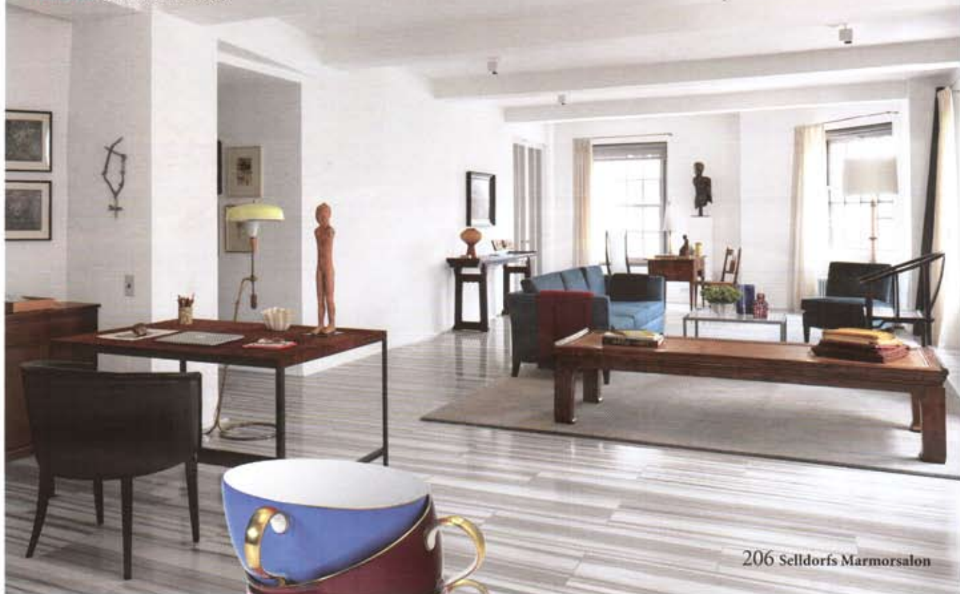
206 Selldorfs Marmorsalon