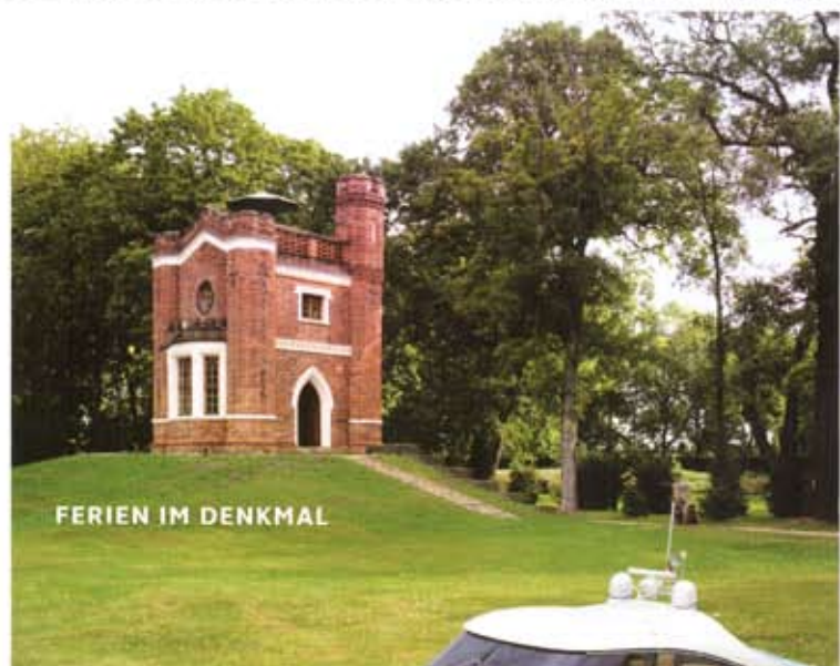
FERIEN IM DENKMAL